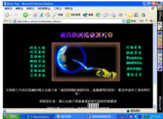
圖 2 資訊與網路資源利用課程網站

一講之內容，學習後參加線上測驗，遇有疑問則可於課後討論和留言板中提出，透過同學間互動以及老師與助教之互動來提升學習成效。