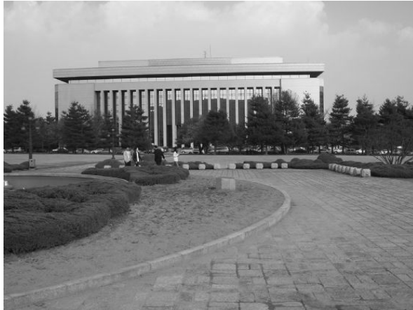
圖 1 韓國圖書館外觀

1963 年 10 月，根據韓國圖書館法，改名為國家圖書館，西元 1974 年遷移到南山公園，在此期間重組了圖書館系統並獲得經費建設新館；西元 1988 年 5 月，新館在首爾南部開館， 21 具有國家圖書館和公共圖書館的雙重功能（參見圖一）。