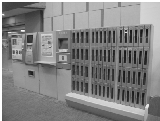
圖 3 預約借書的書櫃。