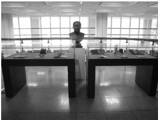
圖 4 圖書館展覽區

二樓有語言文學類書籍、圖書資訊室，和東亞和北韓館藏。圖書資訊室為提供圖書館員使用的專門圖書室。兩翼之間的空間為展覽區，擺置文學家的銅像與手稿（參見圖 4）。館內很特別的設備是及時性資料取用觸控螢幕（參見圖 5），這個特別的裝置可以顯示圖書館資源是否被使用，當使用者從書架取下書籍閱讀時，需要先透過這個機器掃描條碼，才可以拿到館內其他地方使用，因此，可以從該機器收集即時統計圖書資源的使用情形，供未來圖書採購參考。