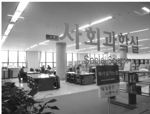
圖 6 社會科學館藏樓層

三樓有政府出版品、國際組織文獻室（UN-OECD），連續性出版品，報紙，四樓有人文科學、社會科學和自然科學館藏（參見圖 6）。