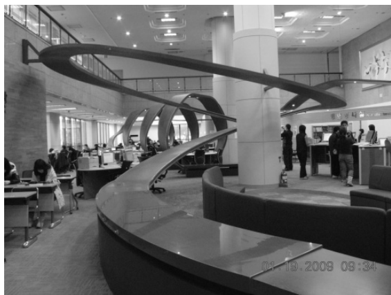
圖 2 大型紅色迴旋似的線條象徵著資訊流通自由傳遞

進入圖書館大廳，映入眼簾的是大型紅色迴旋似的線條，代表韓國傳統四樂表演時帽子帽帶旋轉的意象，象徵著資訊流通自由傳遞(參見圖 2)，一旁是主要流通櫃檯和資訊服務。資訊服務提供了自助式還書機器(參見圖 3)，可提供晚間(六點到十點)圖書館的使用者歸還他們所借的書籍，以 RFID 為基礎的資訊管理系統，提供重要的整合系統，可連接韓國圖書館資訊系統(Korean Library Information System, KOLIS)和圖書館借閱證結合在同一個系統上。有了這個管理系統，可以檢索即時使用者統計資料和被使用的資源，強化使用者親近性的服務。