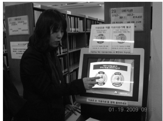
圖 5 及時性資料取用觸控螢幕

三樓有政府出版品、國際組織文獻室（UN-OECD），連續性出版品，報紙，四樓有人文科學、社會科學和自然科學館藏（參見圖 6）。