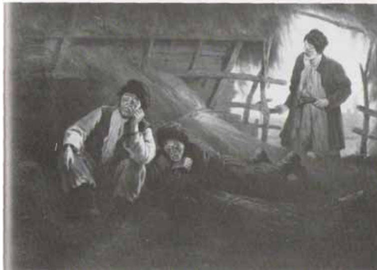
《狄康卡近郷夜話》挿圖

瓦、トルトーフスキイ画(1874～76年)「ディカーニカ近郷夜話」挿絵(上・下)