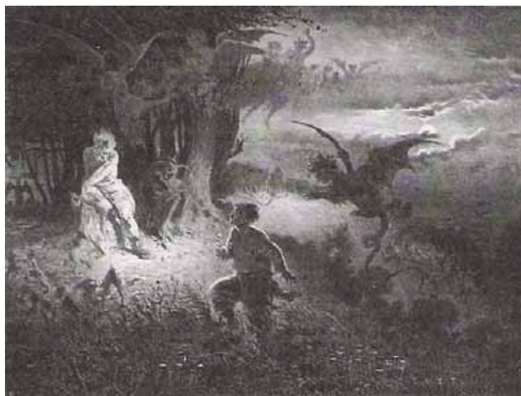
《伊凡·庫巴拉節前夜》插圖

圖片出處：М. Д. Аксёнова глав. ред., Энциклопедия для детей: Русская литература. От былин и летописей до классики XIX века , М.: Аванта+, 2001, с. 493.