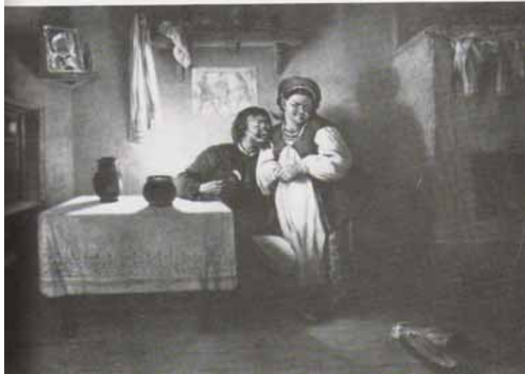
《狄康卡近郷夜話》挿圖