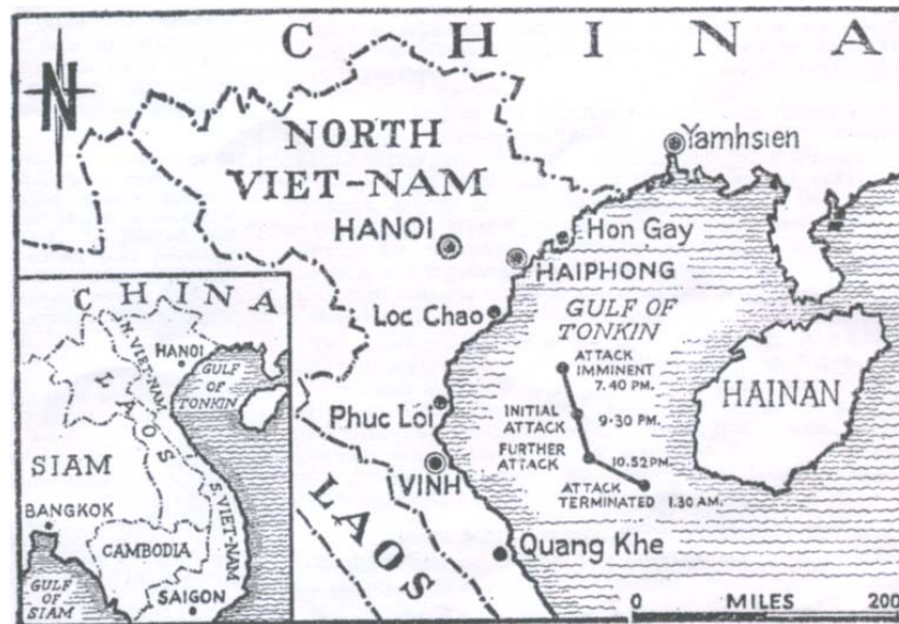
圖 3-2 美軍轟炸北越的四處巡邏艇基地—鴻基(Hon Gay)，綠洲(Loc Chao)，富利(Phue Loi)和廣溪(Quang Khe)及宜安(Vinh)的油槽