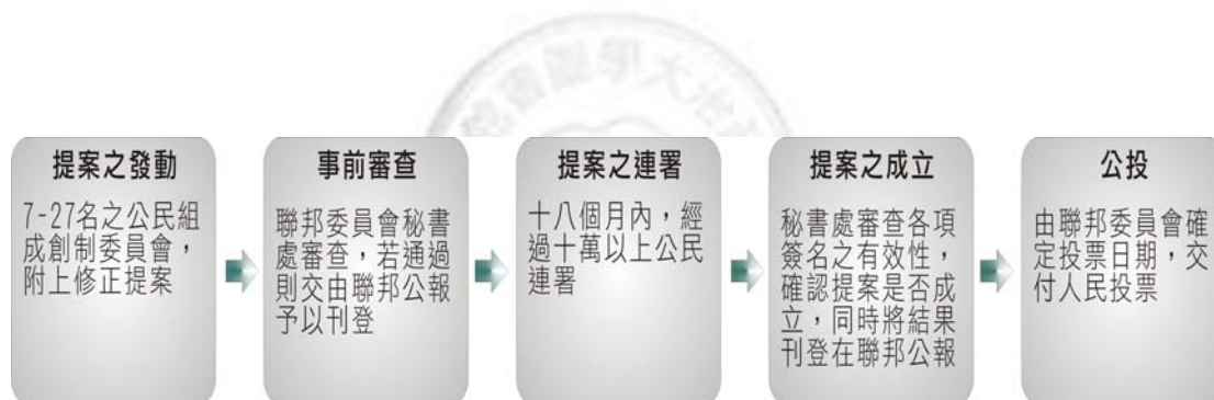
圖 3-2：創制發動的程序 27

在表示二案均獲通過時何者優先的問題上，如其中一案獲得較高的人民同意票，而另一案獲得較高的邦同意票時，以獲得人民同意票與邦同意票之比例加總後最高者為通過。