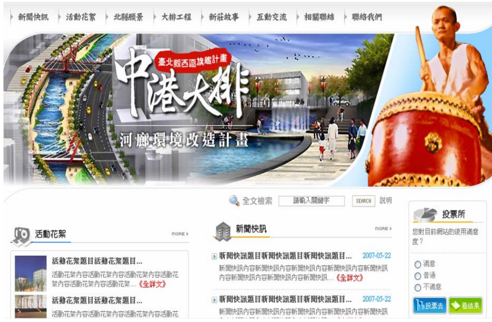
圖4.2 資訊平台首頁圖