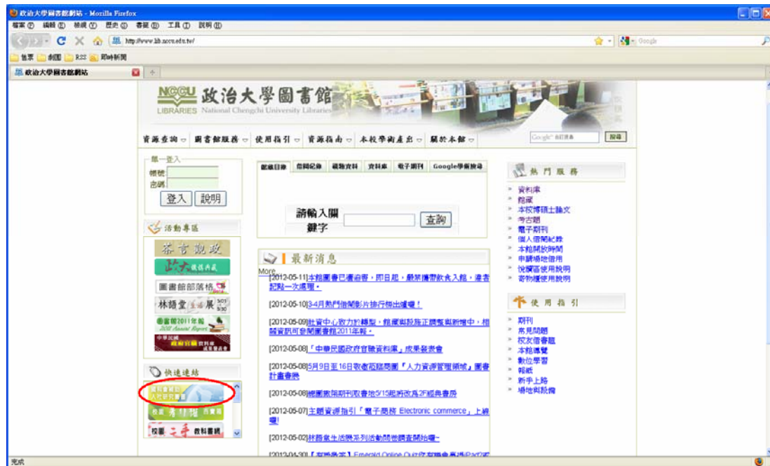
圖二 政大圖書館首頁快速連結