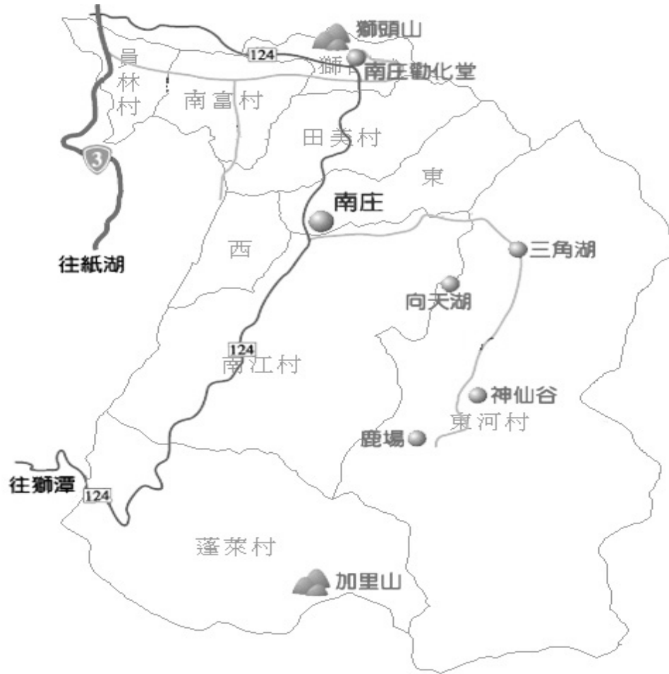
圖 4-1、南庄鄉行政分區圖