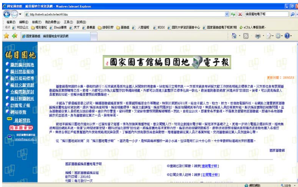
圖 1 編目園地電子報畫面 http://catweb.ncl.edu.tw/sect-8.htm

至 2010 年 9 月止，目前已發行 113 期，訂閱總數 2,493 人。系統目前有建立電子報內文檢索功能，可查詢相關報導資訊。(如圖 2 所示)