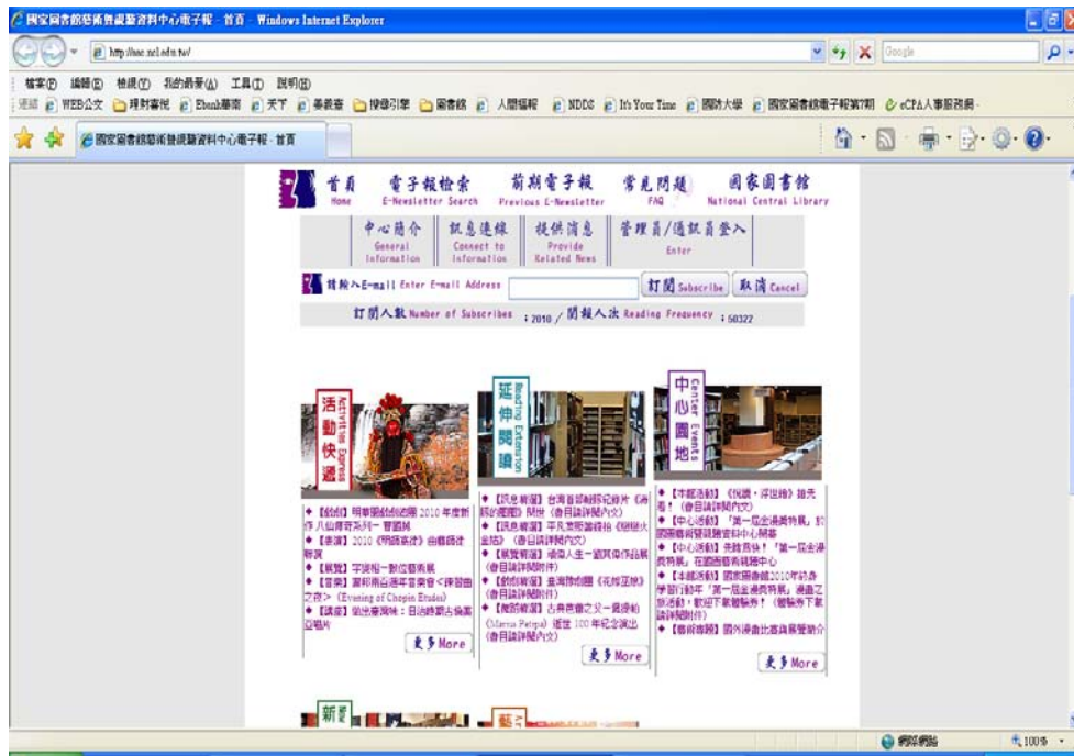
圖5 藝術暨視聽資料中心電子報畫面 http://aac.ncl.edu.tw

總之，國家圖書館藝術暨視聽資料中心特地籌辦電子報，作為藝術界的溝通橋樑。希望提供讀者多元豐富的內容，而延伸閱讀專欄，則善用圖書館的優勢--藏書，帶給讀者不一樣的感受，精選展覽、表演、活動及訊息，提供相關報導，並整理出與該則資訊內容相關的藏書及視聽資料，且提供相關藏書的書目資料，以附加方式，或列於內文中，甚至也有另附相關檔案於附件，方便讀者除閱讀電子報所刊載之內容外，亦可進一步參考相關圖書及視聽資料增進知識(國家圖書館藝術暨視聽資料中心，2010)。故電子報實為傳播藝術資訊的好幫手。