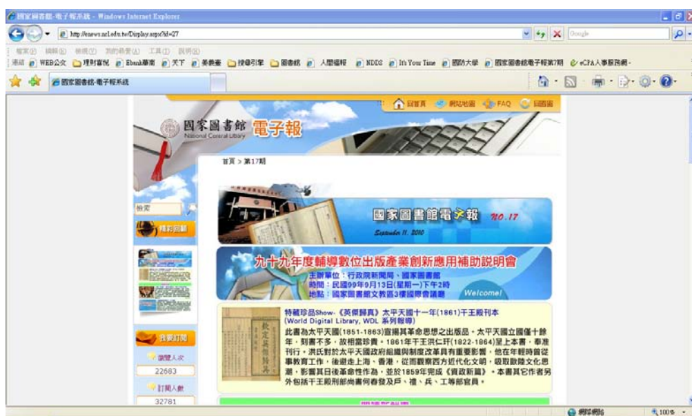
圖 6 國家圖書館電子報畫面

http://enews.ncl.edu.tw/Display.aspx?id=27