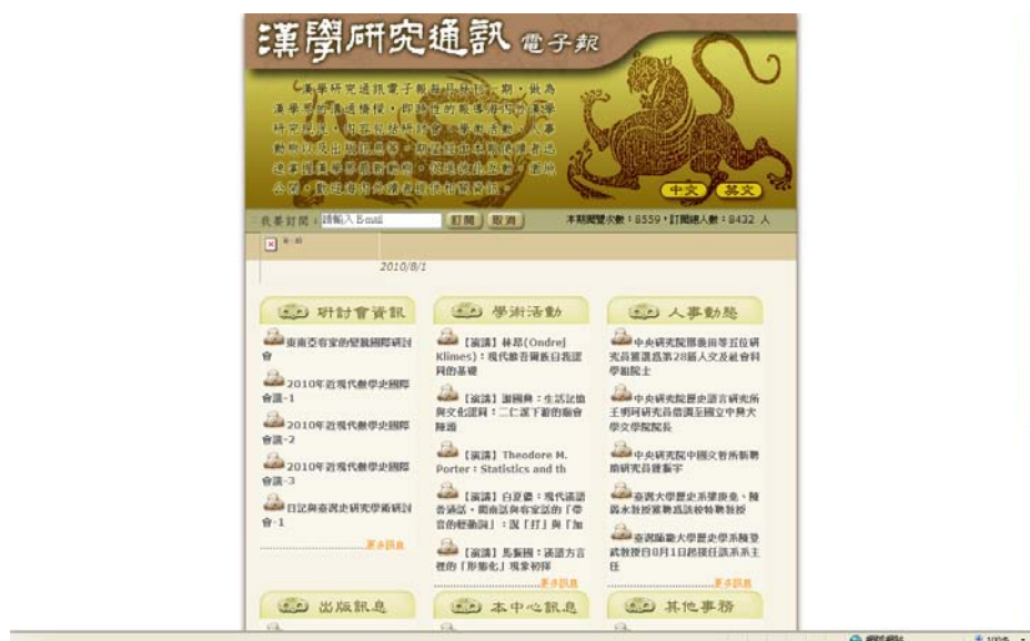
圖 3 漢學研究通訊電子報畫面

http://ccs.ncl.edu.tw/ccsnews/a/epaper_content.asp?EpaperID=56