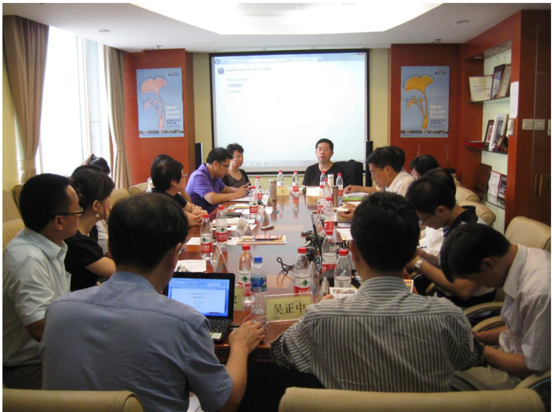
圖五 中國人民大學焦點團體座談會現場