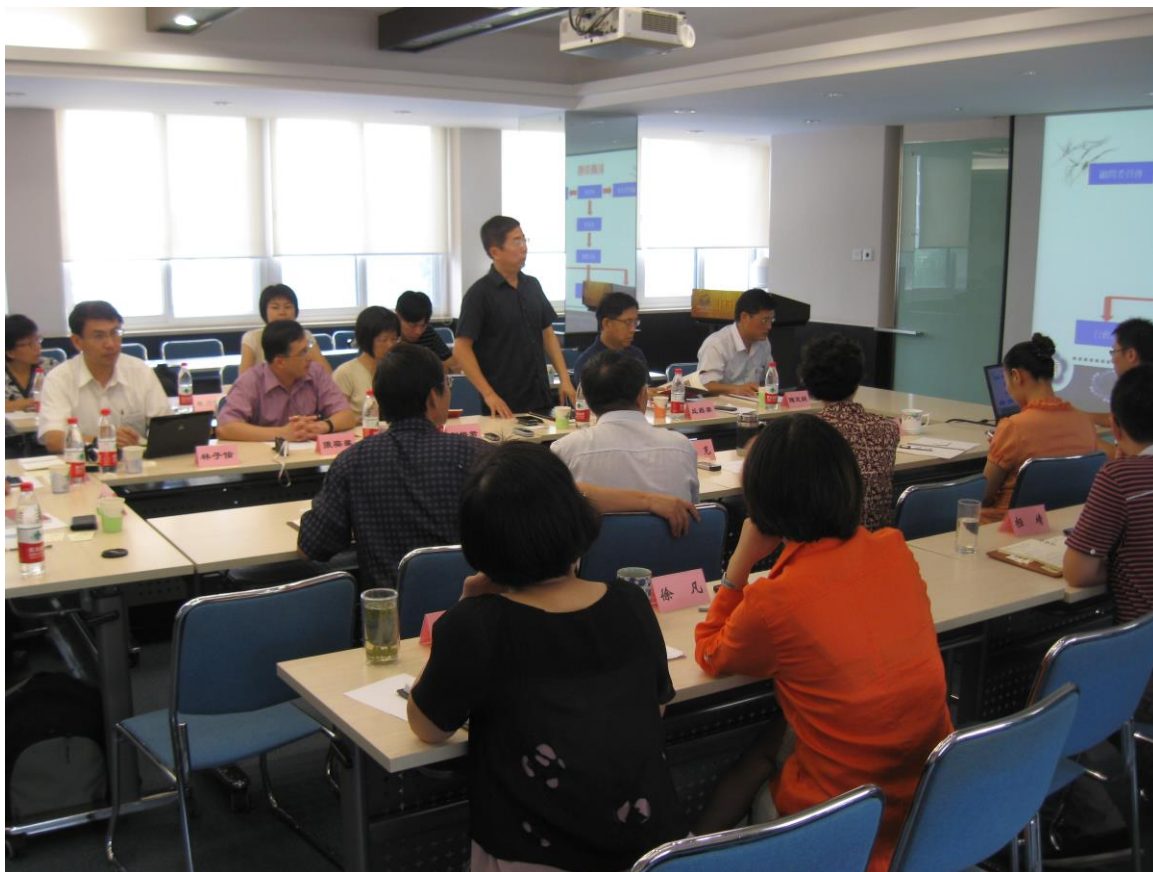
圖三 中國國際民間組織合作促進會焦點團體座談會現場