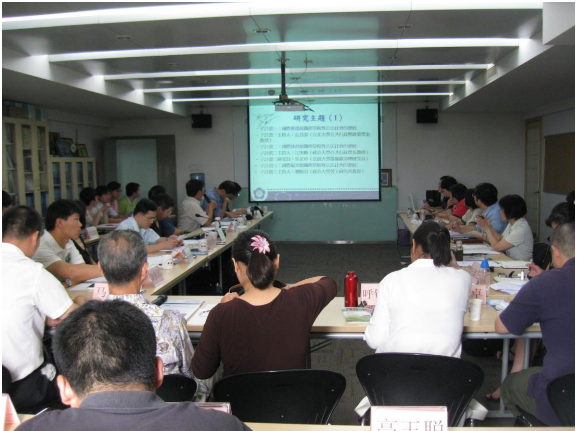
圖四 南都基金會焦點團體座談會現場