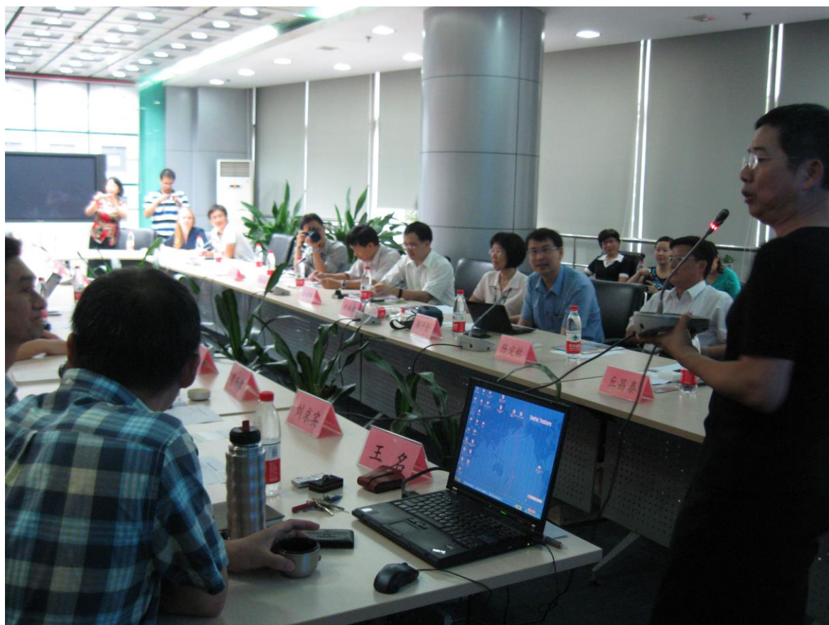
圖一 北京清華大學焦點團體座談會現場

本研究在出發前往大陸進行調查研究前，雖然已經蒐集閱讀大量文獻，但是所得到的資訊還是相當的籠統。而在調查過程與結束後，發現對於這些文獻中所說明的概念更加清楚，也蒐集到可貴的第一手資料。以下也附上相關的照片。