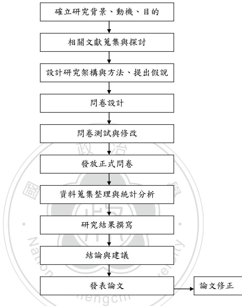
圖 1-1 研究流程